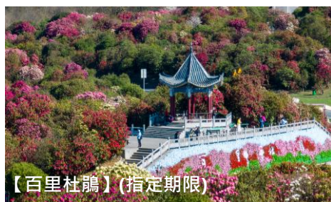
【百里杜鵑】(指定期限)

出發日期：3月6,13,20,27日· 4月3,10,17,18,19,24日·5月8,15,22,29日