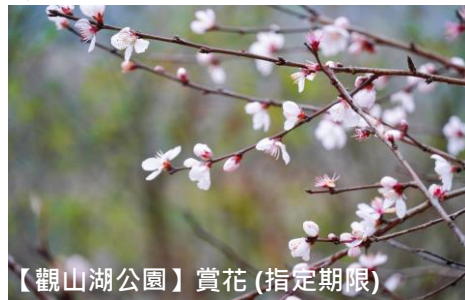
【觀山湖公園】賞花 (指定期限)

中國唯一以杜鵑屬植物為保護對象的杜鵑林觀賞區 國家5A景區，以及世界上唯一的杜鵑花國家森林公園。