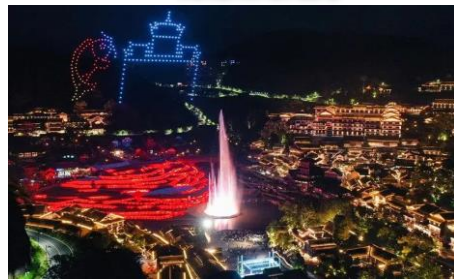
『烏江寨景區晚上無人機表演』